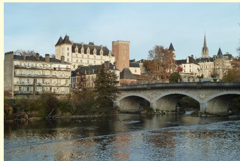
Le château de Pau depuis Jurançon

Liaison TER 55 de Pau à Bedous – Liaison bus de Bedous à Canfranc