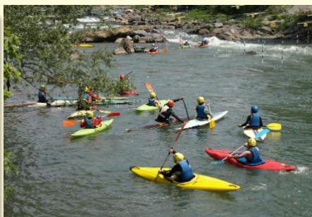
Kayakistes sur le Gave de Pau