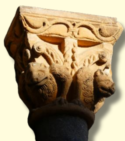
Chapiteaux de la Cathédrale d'Oloron

Probablement dédiée au commerce au XIV ème siècle, cette tour prend de l'ampleur au siècle suivant, ses propriétaires souhaitant montrer leur aisance par l'intermédiaire d'une architecture originale. La tour abrite actuellement une grande collection sur la faune pyrénéenne.