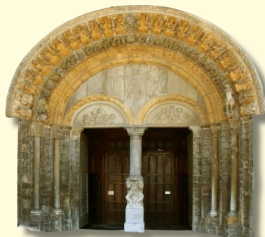
Portail de la Cathédrale d'Oloron